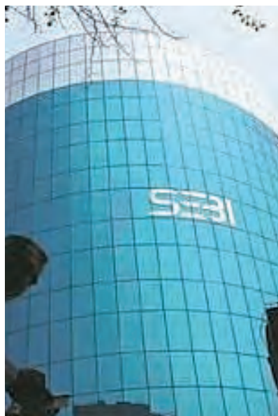
Sebi said Chairperson Madhabi Puri Buch had made relevant disclosures about securities held by her. She also recused herself in matters involving potential conflicts of interest

Regarding its show-cause notice to Hindenburg Research, Sebi noted that the matter is ongoing and being handled "in accordance with established proce-